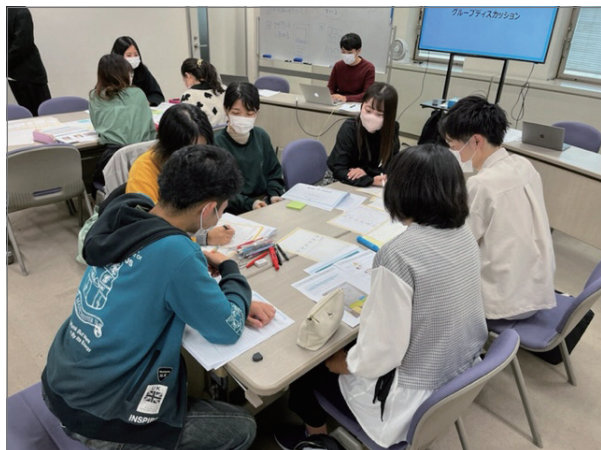
写真 グループワークの様子

また、登場人物が動画内で見せる表情や会話の内容などについても協議を重ねました。若者の共感を呼ぶためには、アニメ映像を活かした非現実的なシーンを取り入れて、インパクトのある動画にするだけでなく、若者が事例を「自分ごと」としてとらえられるようにする必要があります。話し合いを通し、若者がキャラクターに親しみを覚え、身近な問題として真剣に向き合えるよう、会話の流れや登場人物の表情など